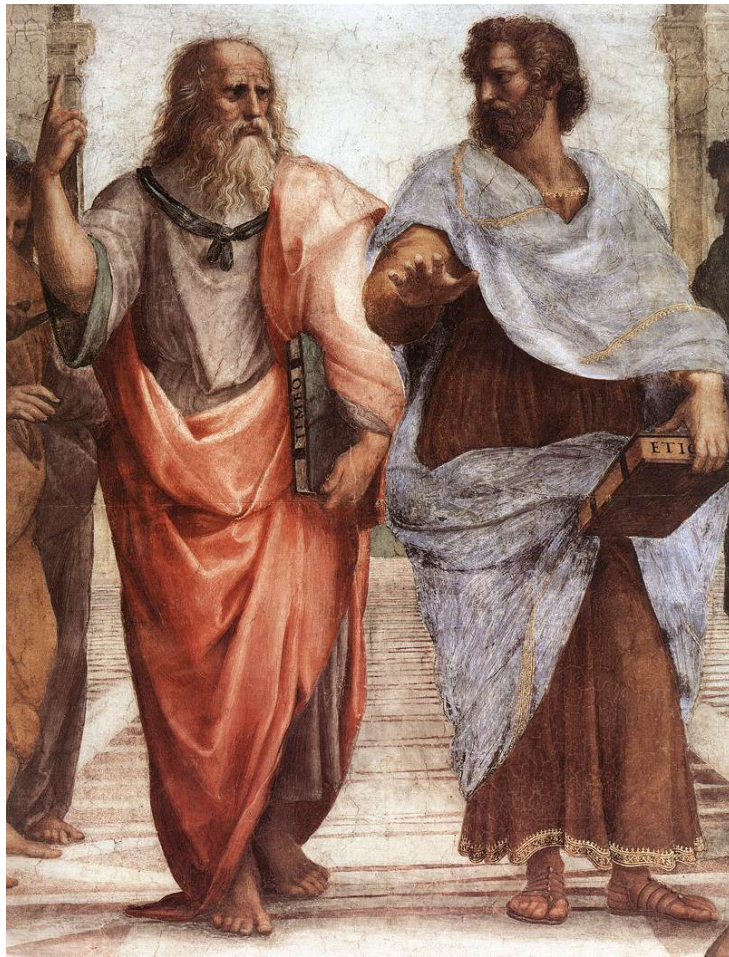
PLATÓN Y ARISTÓTELES, DETALLE DE LA ESCUELA DE ATENAS, PINTURA DE RAFAEL.