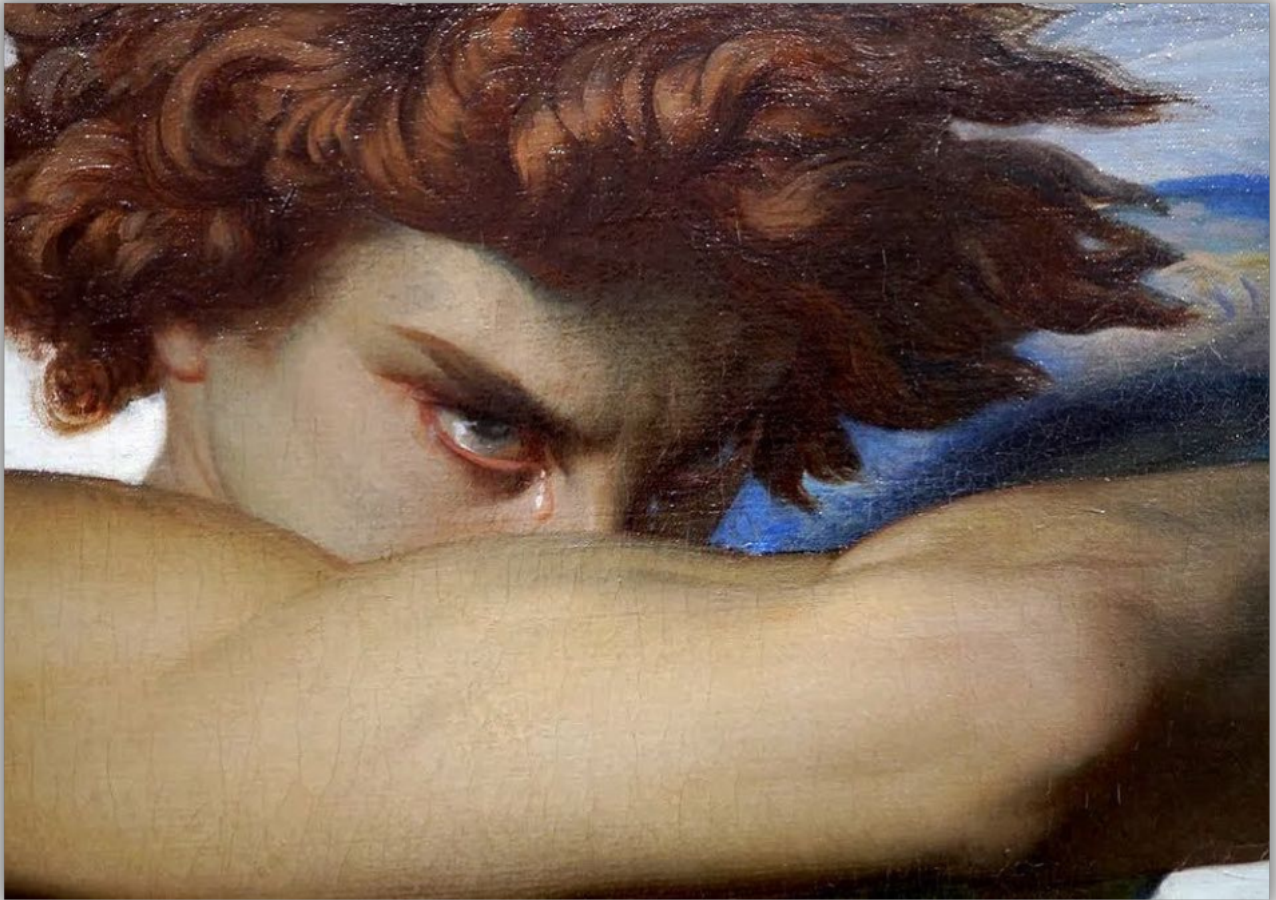
DETALLE DE "EL ÁNGEL CAÍDO", ALEXANDRE CABANEL (1823-1889)